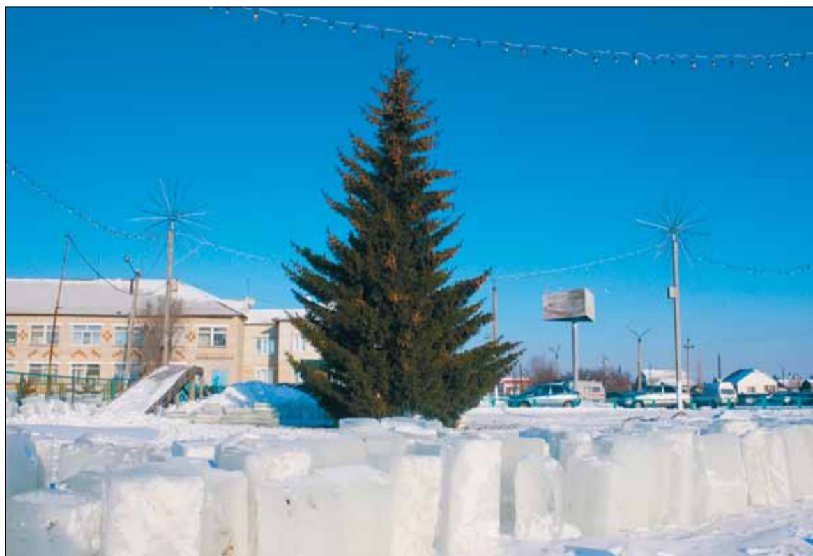
Возле районной больницы начались работы по установке ледяного городка.

Традиционно планируется оформление снежных городков и установка горок, иллюминации у районной больницы, сельхозтехники, комбината хлебопродуктов, автотранспортного предприятия, ТЦ «Солнеч-